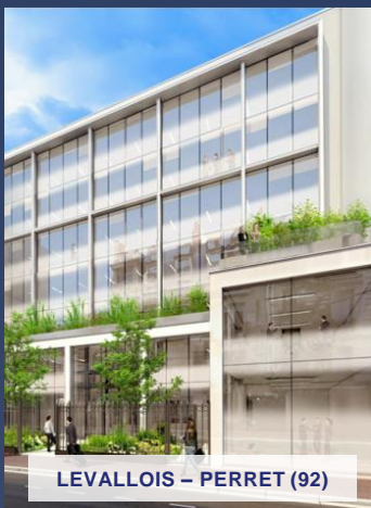
LEVALLOIS – PERRET (92)

Exemple d'investissement déjà réalisé. Ne constitue pas un engagement quant aux futures acquisitions.