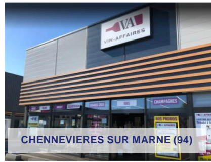
CHENNEVIÈRES SUR MARNE (94)