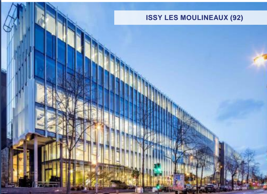
ISSY LES MOULINEAUX (92)

Exemple d'investissement déjà réalisé. Ne constitue pas un engagement quant aux futures acquisitions.