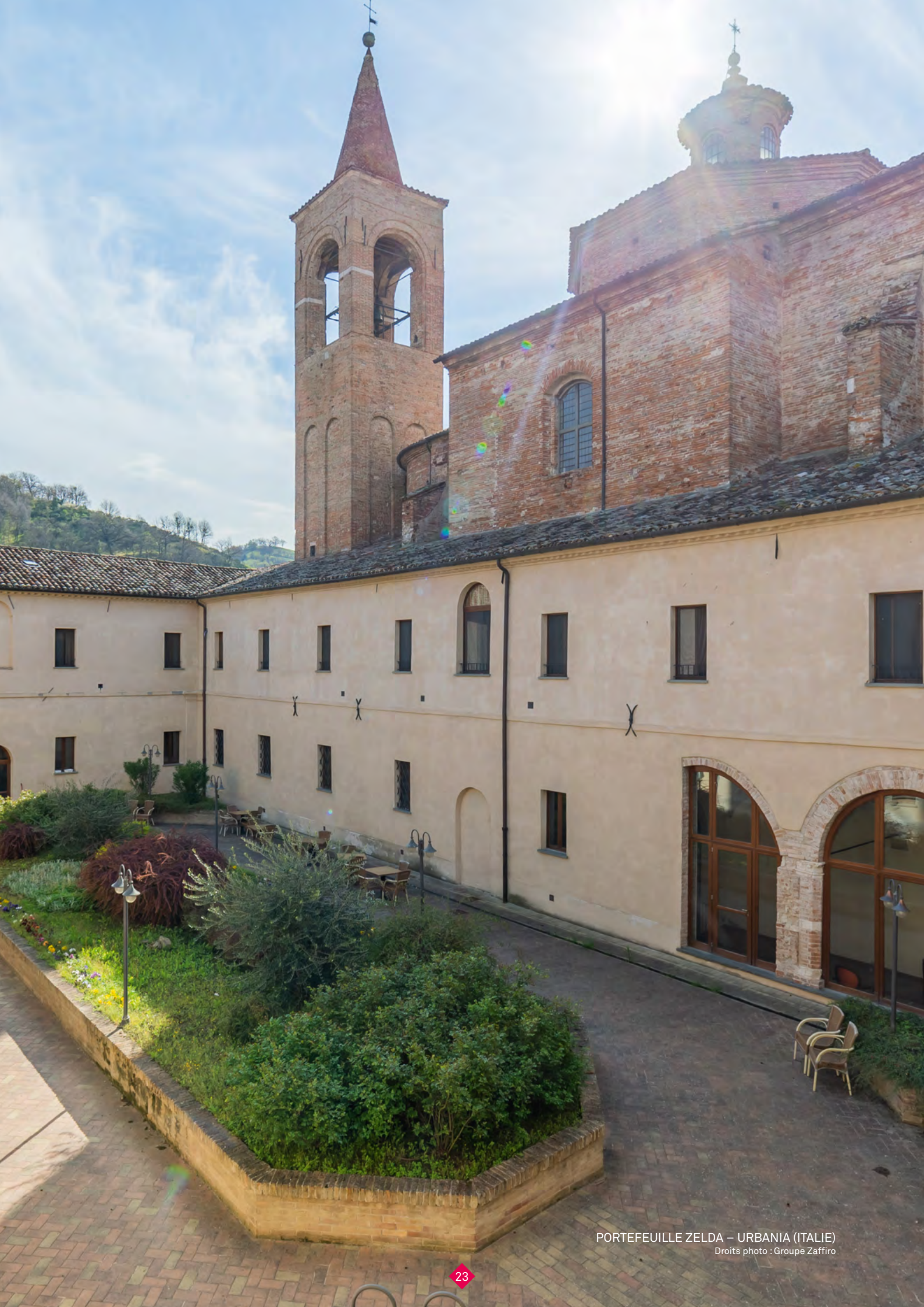
PORTEFEUILLE ZELDA – URBANIA (ITALIE)