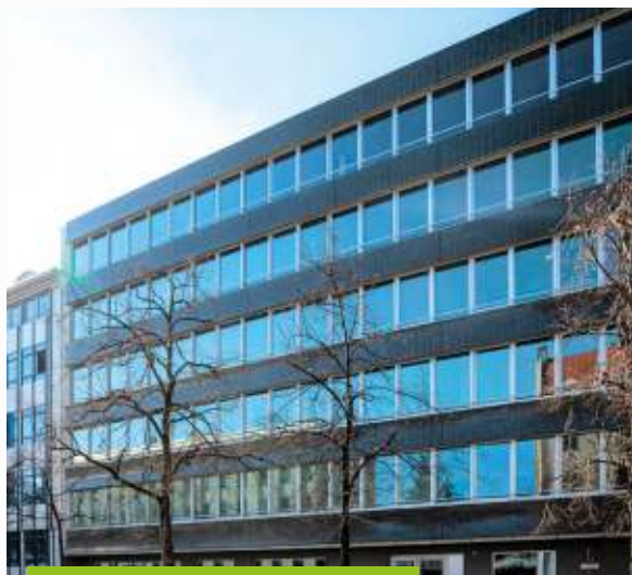
Immeuble de bureaux - H TRIUM - Munich

* Rappel : au 1 er semestre 2021 (6 mois), le TOF « ASPIM » était de 98,3 % et le TOF « BRUT » de 1,7 %.