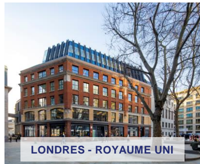
LONDRES - ROYAUME UNI