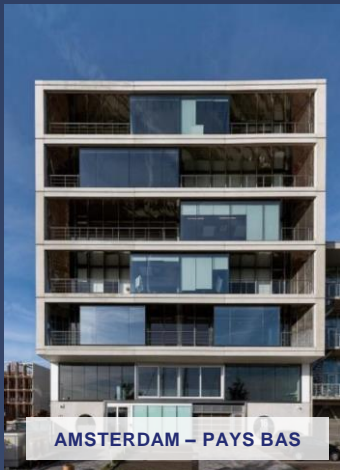
AMSTERDAM – PAYS BAS

Exemple d'investissement déjà réalisé. Ne constitue pas un engagement quant aux futures acquisitions.