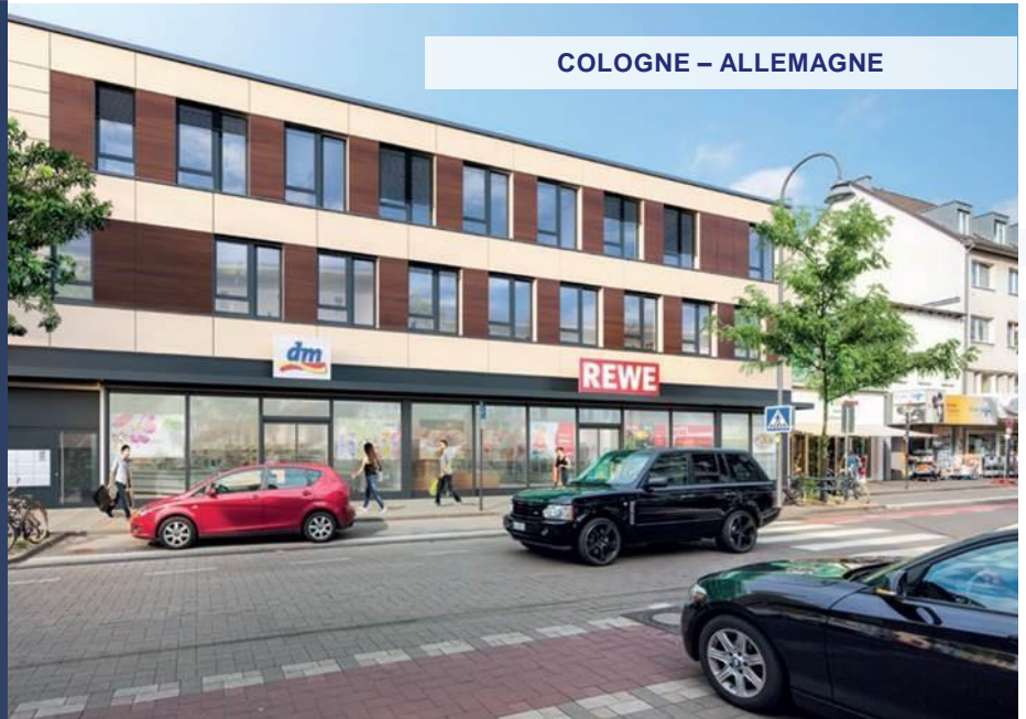
COLOGNE – ALLEMAGNE

Exemple d'investissement déjà réalisé. Ne constitue pas un engagement quant aux futures acquisitions.