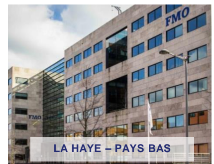
LA HAYE - PAYS BAS

Exemples d'investissement déjà réalisés. Ne constitue pas un engagement quant aux futures acquisitions.