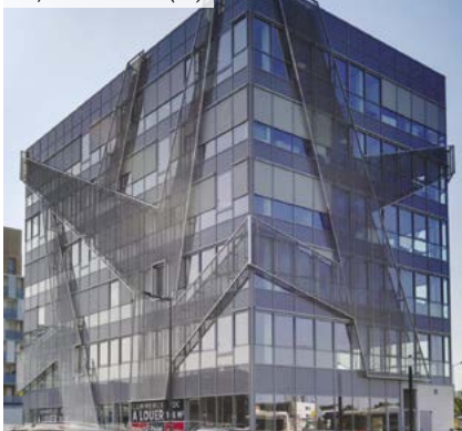
Skyline – Toulouse (31)

*** Pour les non résidents, seuls les immeubles détenus sont pris en compte.